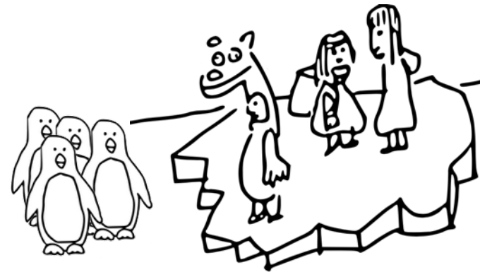
Dessins: Silvio Palomo

Avec ØRIGINE, il s'agit d'interroger notre rapport à la durée. Comment faire ressentir cette chose impalpable qu'est le temps ? Le théâtre, il me semble, permet d'utiliser le temps comme une matière modelable qui s'étire ou se comprime. Une succession d'instant indivisibles où le passé, le présent et le futur ne font qu'un.